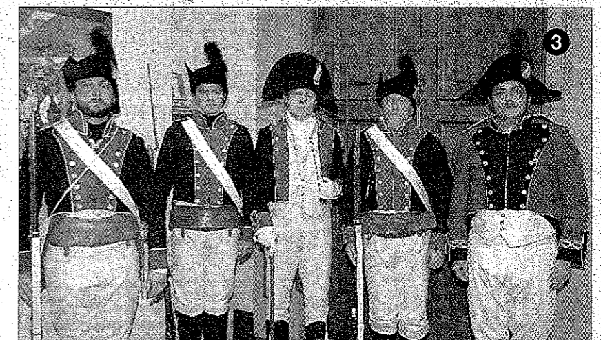
►►Escenas► 1► Todos los premiados posaron juntos al finalizar el acto. 2► Autoridades y miembros de la asociación Los Sitios, en una foto de familia. 3►► El regimiento de Infantería de la Asociación de Voluntarios de Aragón acudió con sus habituales uniformes, recordando los modos y costumbres del Ejército en 1808.