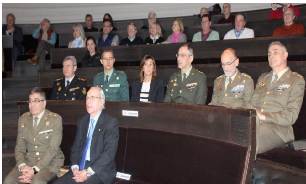
Aspecto parcial del Aula Magna (II)