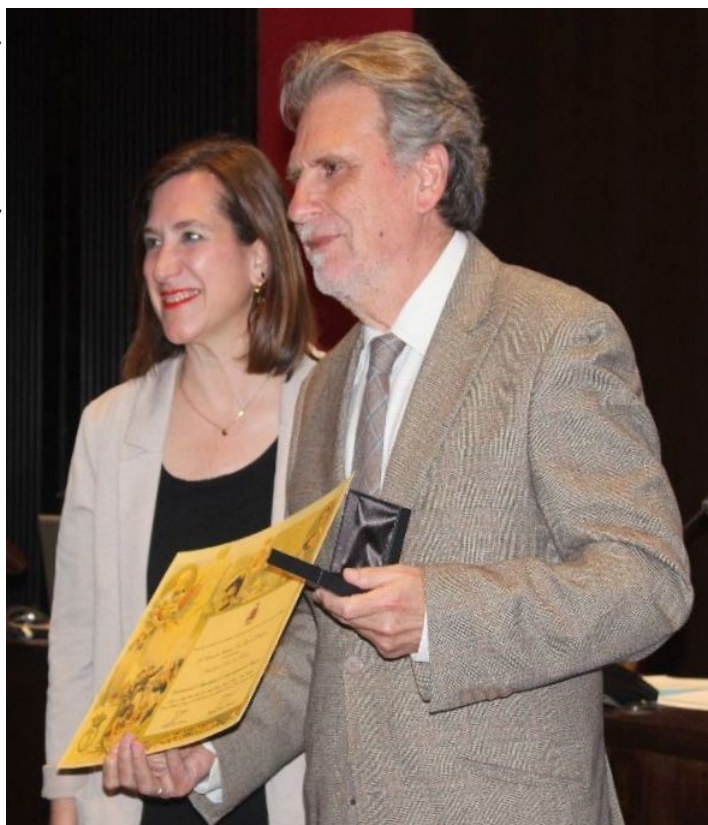
Medalla Socio de Honor Colectiva