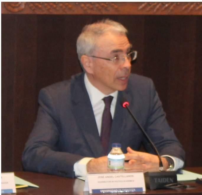
Vicerrector de Política Académica