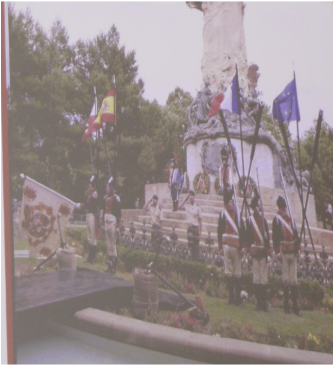
Monumento a los Sitios

Eso es algo que algunas veces nos favorece y en otras no tanto. Lo he puesto ahí y lo recordamos con la ayuda de los Voluntarios de Aragón, el ejército, que nos ayuda mucho, sobre todo el Regimiento de Pontoneros y la Brigada Aragón, que nos presta su Banda de Guerra. Es un acto muy emotivo, porque les quiero recordar que este monumento y la exposición se hizo sobre un terreno que fue campo de batalla en 1808. Ahí murieron muchas personas defendiendo Zaragoza, especialmente en el Primer y Segundo Sitio.