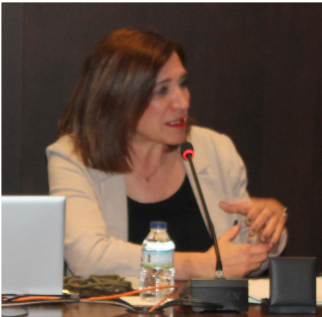
Vicealcaldesa de Zaragoza

Pero ahora estamos hablando del pueblo llano, de toda la gente que sufrió los Sitios, de la gente que murió en combate, de la gente que murió de las enfermedades, que están enterrados por miles allí mismo en la arboleda de Macanaz. Por fin se ha conseguido sacar adelante este monumento con el esfuerzo, desde hace 20 años, de diversas asociaciones como la Asociación de Vecinos del Arrabal; Asociación Tío Jorge; Asociación Royo del Rabal. Por fin el ayuntamiento nos ha podido sacar adelante este proyecto que ahora vamos a poder ver cuando crucemos el puente de Santiago. Dejamos así un legado imperecedero los zaragozanos de hoy para aquellos zaragozanos que hace más de 200 años se dejaron la vida en los Sitios de Zaragoza.