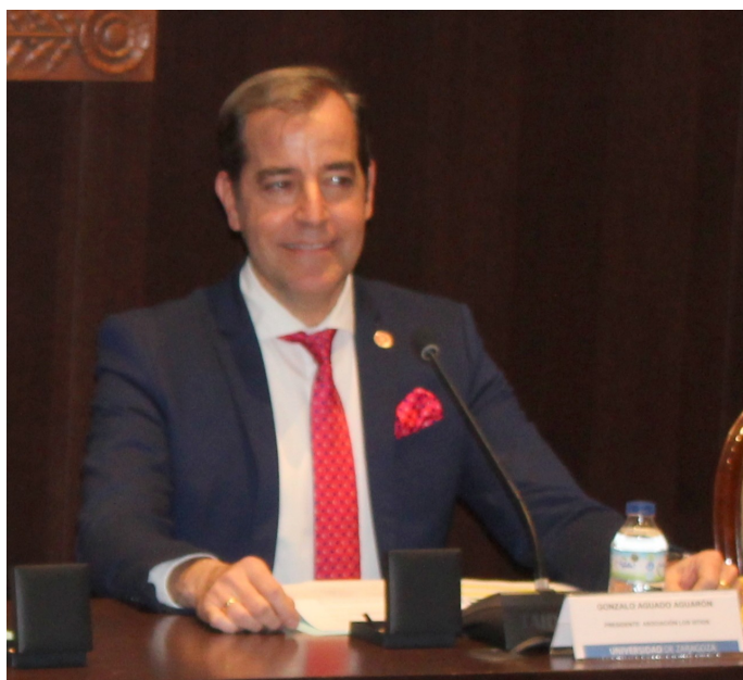
Presidente de la AC los Sitios

Se inició el acto con estas palabras del Vicerrector de Política Académica: es un placer estar hoy aquí con todos ustedes porque entendemos, los que somos ciudadanos de Zaragoza, que gracias a ustedes, gracias a la asociación, se mantienen vivos valores esenciales de lo que es nuestra ciudad y nuestra historia. Les animo a que esto siga vivo por muchos años, porque nuestras jóvenes generaciones deben ser conocedoras de todo aquello que acontece en nuestro día a día, porque muchas de las cuestiones que vivimos alrededor de nuestra ciudad se deben a estos momentos tan relevantes. Muchas gracias a la asociación por estos valores que transmite.