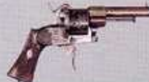
Revólver adetta Lebauchoux. Fabricado por Salvador Oteiza en Vitoria-Gasteiz - Siglo XIX