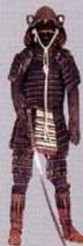
Armadura japonesa de Samurai de finales del XVI

Las armas árabes destacan por su abigarrada decoración a base de motivos geométricos, inscripciones y leyendas.