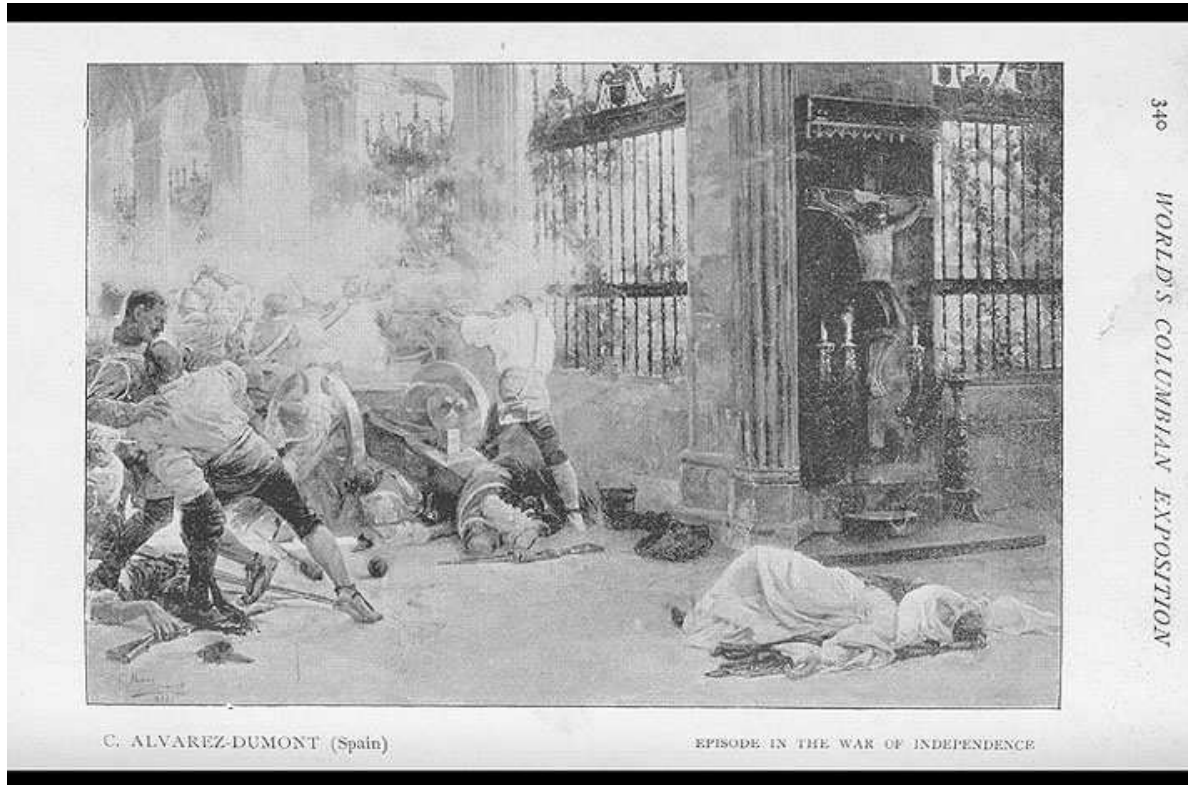
Santa Engracia de Álvarez Dumont