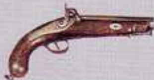
Pistola de "pistón" con inscripciones "Ignacio Adolfo Eibar 1811"