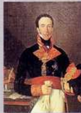
Retrato del General Arce. (Luis B. 1870)

De esta época contamos con armas de ambos bandos, así como piezas de uniformes, documentos y otros objetos. Se exhiben también maquetas y dioramas que representan diferentes momentos del desarrollo de este acontecimiento bélico.