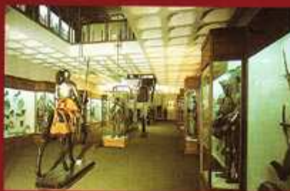
Interior del museo