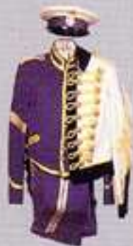
Uniforme de Músicos de la Princesa. 1906-1911

Por otro lado, se exhibe además un conjunto de uniformes pertenecientes a la época del rey Alfonso XIII.