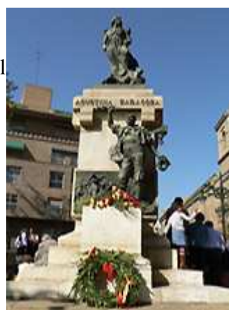
Monumento en honor a Agustina de Aragón