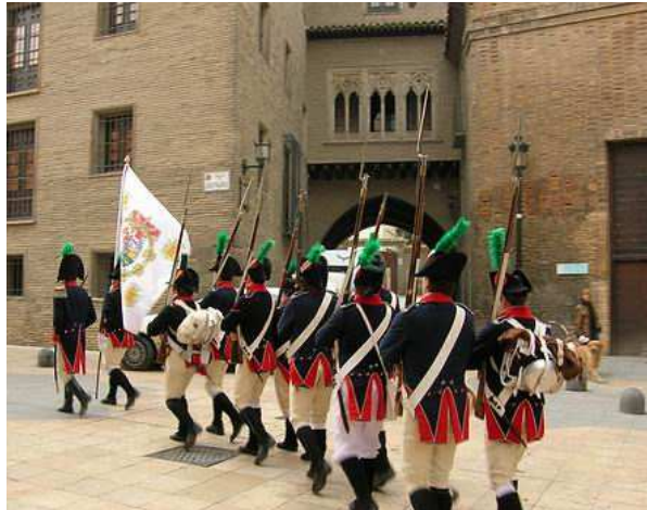
Desfile de los Voluntarios de Aragón por las calles del casco histórico.

Dentro de las actividades culturales de la Asociación de vecinos y consumidores y usuarios 1808 del barrio de San Miguel , el domingo 17 de diciembre de 2006, a las 12:00 horas, en la Casa Palafox (C/San Vicente de Paul) de Zaragoza, tuvo lugar por tercer año consecutivo, el Homenaje al general Palafox, coincidiendo, como en años anteriores, con el aniversario del comienzo del segundo Sitio de Zaragoza.