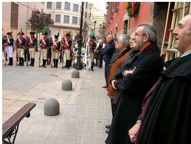
Presidentes de las asociaciones participantes.

Seguidamente a la colocación de la corona, los Voluntarios de Aragón efectuaron una descarga con sus fusiles de época, tras lo cual se cantó una jota alusiva por el grupo Royo del Rabal.