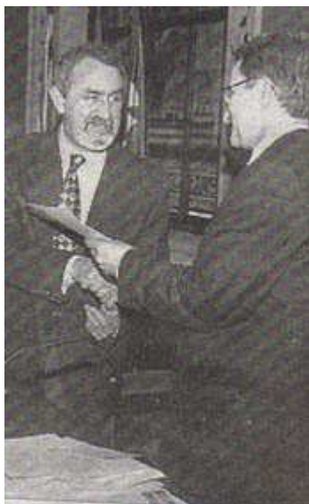
Entrega de premios, ayer.