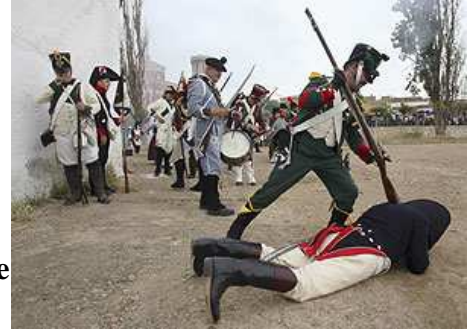
Un momento de la recreación.

La iniciativa se puso en marcha hace algunos años en distintos puntos de la geografía española. En esta ocasión, ha sido Aragón el territorio elegido para reconstruir un capítulo de la histórica Guerra de la Independencia, bajo la denominación de " 1ª Recreación Histórica de la Batalla de Cariñena y Homenaje a la Bandera de Gayán ".