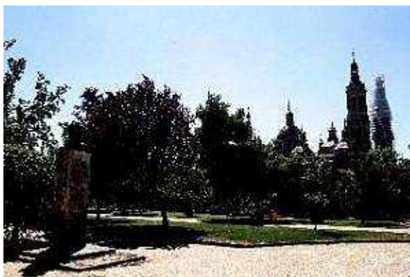
El parque de Macanaz, situado a orillas del río Ebro.

La asociación. Tío Jorge propone dedicarlo a los héroes anónimos de Los Sitios. En un mes se han logrado algo más de 500 rúbricas que se llevarán al distrito.