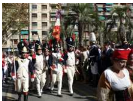
Un momento del desfile