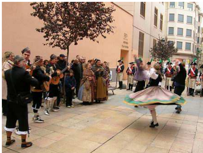
Asociación Royo del Rabal, con su grupo folklórico de jota.

El acto contó con la colaboración de la Asociación Los Sitios de Zaragoza , así como de la Asociación histórico Cultural Voluntarios de Aragón , también, la Asociación Royo del Rabal , con su grupo folklórico de jota, así como la de Amigos de la Capa .