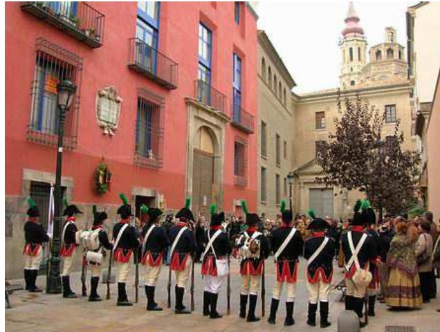
Homenaje al general Palafox.

Tras un desfile de los Voluntarios de Aragón y restos de organizadores por el Casco Histórico de la ciudad (calle D. Juan de Aragón, siguiendo por la plaza Santa Marta, calle Dormer, plazas de La Seo y San Bruno, para terminar en la calle Palafox, al pie de la placa dedicada al general), se procedió a la colocación de una corona de laurel en la lápida conmemorativa de la fachada de la casa natal de Palafox.