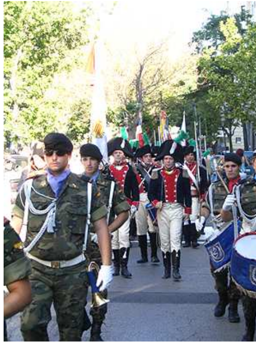
Comienza el desfile por la calle Costa. Al fondo los Voluntarios de Aragón.