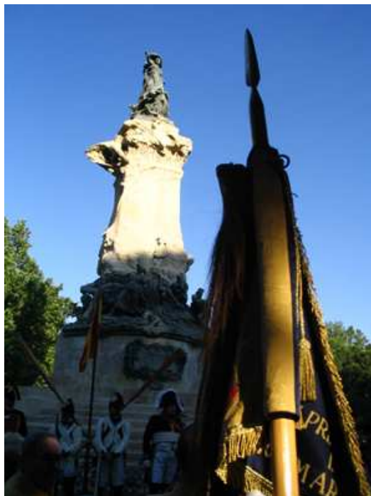
Banderín de Escuadrón. Castillejos.