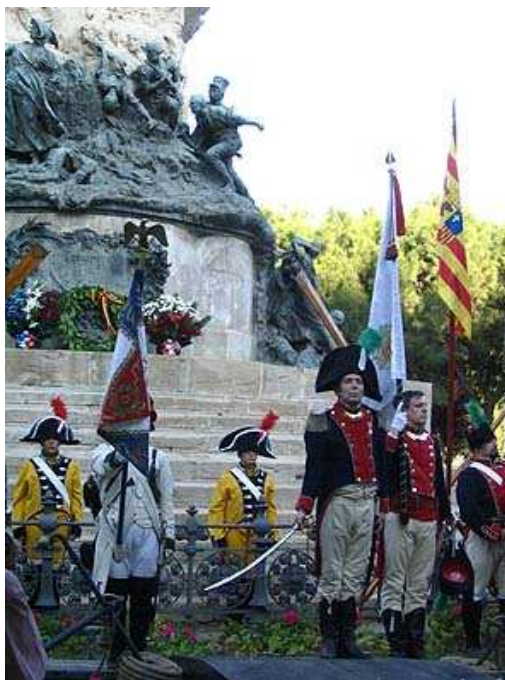
El toque de oración fue interpretado por la banda de Castillejos , en medio de un emocionado silencio.