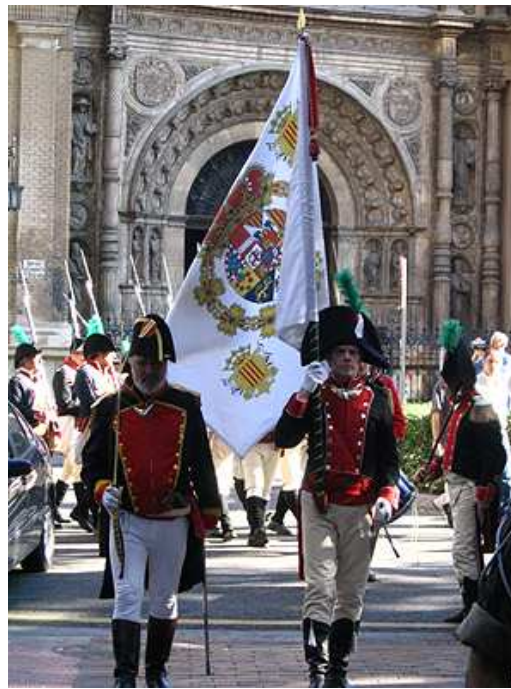
El desfile entrando por la calle Inocencio Gimenez. Detrás de los Voluntarios la iglesia de Santa Engracia.