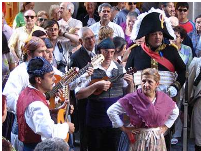
El descubrimiento de la placa, corrió a cargo de dos miembros del Grupo Folklórico "Royo del Rabal". Tras una salva de honor de los Voluntarios, sonó una jota alegórica al acto.