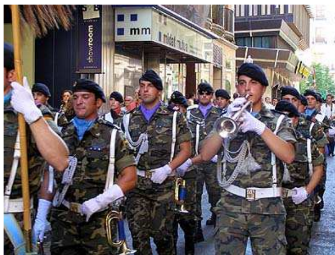
La Banda de guerra de la Brigada de Caballería “Castillejos” II.