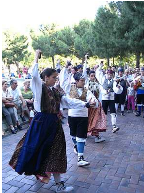
El acto incluyó las jotas del Royo del Rabal .