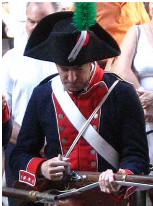
Los Voluntarios, junto a los de Asociación Napoleónica.