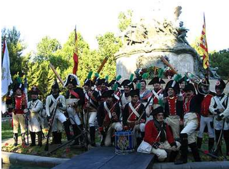
Fotografía en "familia".