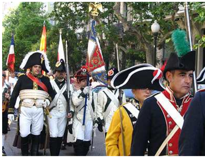
Miembros de la Asociación Napoleónica Española.