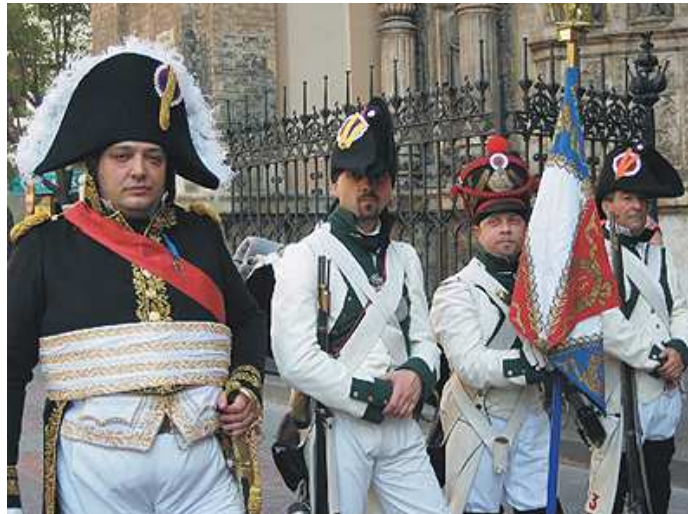
Formados ante una magnífica iglesia de Zaragoza, la representación coruñesa del ejército francés. Un Mariscal y sus soldados, listos para el desfile por las calles de la ciudad.

En la ciudad de Zaragoza, tuvieron lugar los días 17 y 18 de junio de 2005, la conmemoración de los Sitios de Zaragoza, invitados por la Fundación Zaragoza 2008, (que amablemente nos subvencionó el alojamiento) Asociación Los Sitios y la Asociación Histórico Cultural "Voluntarios de Aragón", una representación de los miembros de la Asociación Histórico Cultural "The Royal Green Jackets" de La Coruña y el presidente de la Asociación Batalla de Brión de Ferrol, ataviados con uniformes del 3º y 15º de Línea francés y Capitán de los Voluntarios de la Victoria, acudieron a la invitación de dichos actos.