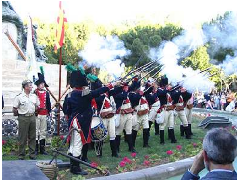
Para la salva de honor. Fin del homenaje.