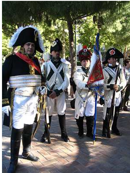
Vistosos trajes de los integrantes de la Asociación Napoleónica Española.