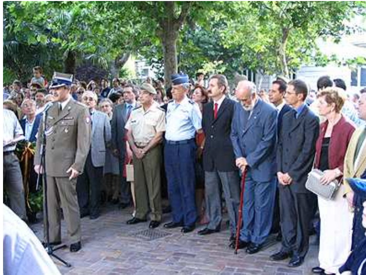
En la plaza de Los Sitios, discursos. Agregado de defensa de la embajada de Polonia en España. Coronel Zbigniew Bochenek.