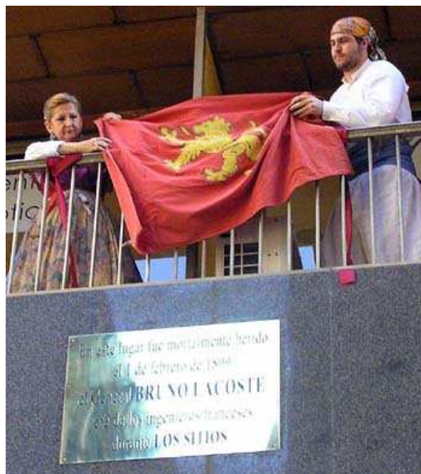
En la fachada del Edificio Sanclemente se descubrió una placa en recuerdo del general Lacoste.