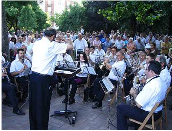
La Banda de la Diputación Provincial de Zaragoza, hizo vibrar al público con los acordes de El Sitio de Zaragoza .