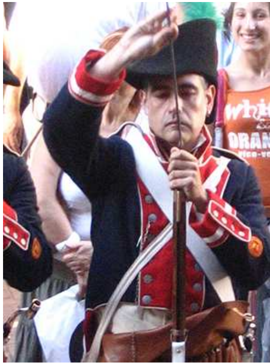
Preparando los fusiles.