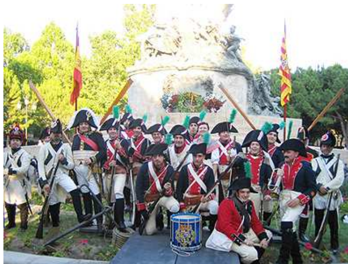
Instantánea del numeroso grupo de los Voluntarios de Aragón, presidente de la Asociación Batalla de Brión y "The Royal Green Jackets", juntos frente al monumento de los Sitios de Zaragoza, después de los actos de homenaje.