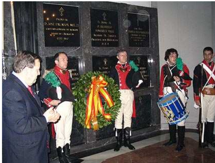
Ante la tumba de Palafox se rezó un responso y se colocó la corona de laurel.