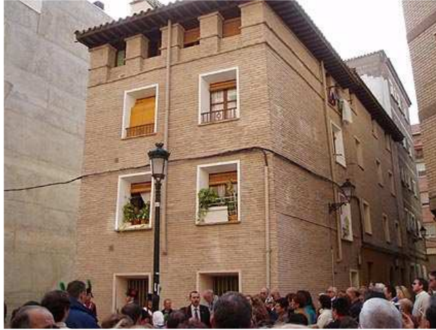
Casa muy restaurada pero que conserva el sabor de las construcciones tradicionales aragonesas.