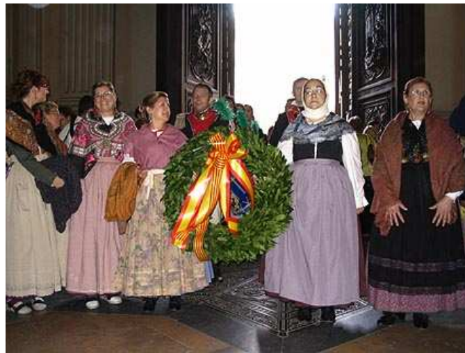
Grupo Royo del Rabal, portando la corona de laurel.