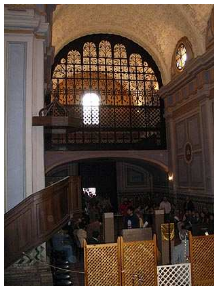
Interior de la iglesia de las Fecetas, un monumento nacional.