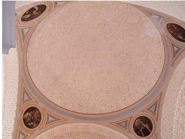
Techo de la cúpula.