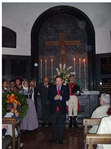
Un año más el Cabildo nos hizo el honor de ser los primeros en entrar a la cripta.