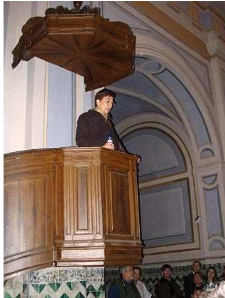
Quien destacó la belleza de las elaboradas yeserías de tradición mudéjar.