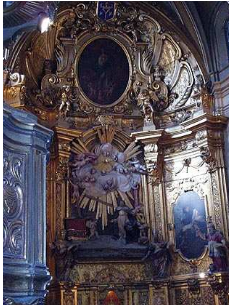
Retablo de la iglesia.