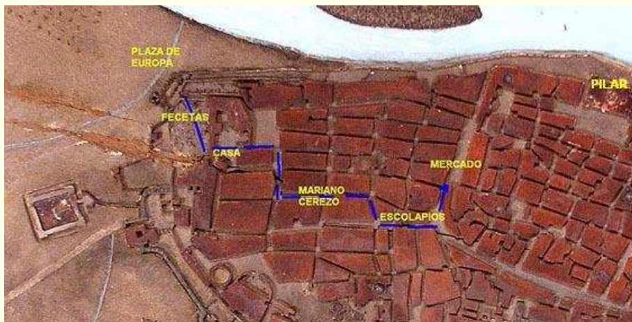
Maqueta de Los Sitios. Museo del Ejército.