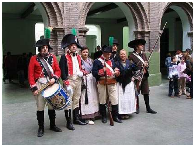
Voluntarios de Aragón en el patio.