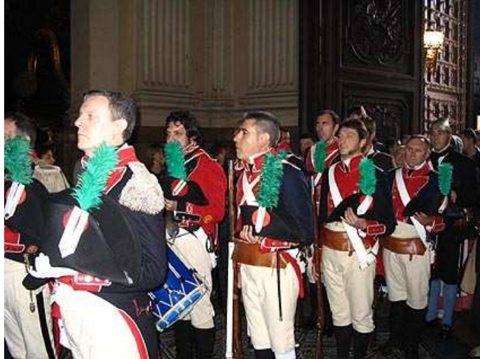
Entrando en la Basílica del Pilar.