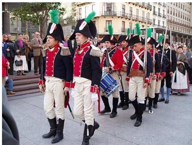
Voluntarios de Aragón desfilando.